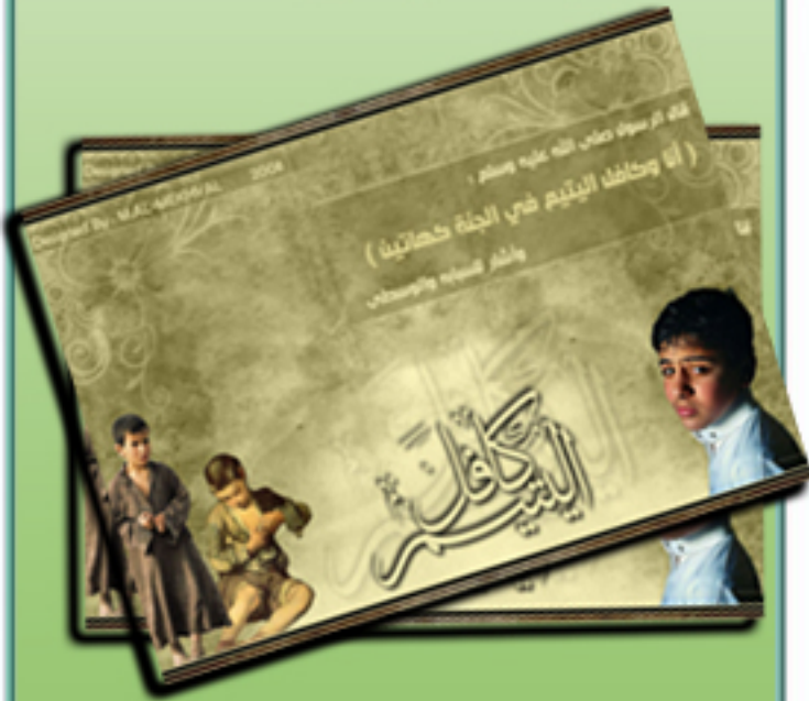
من تصاميم : محسن الخيال